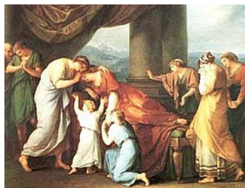
Alcestes død. Angelica Kauffman 1741-1807